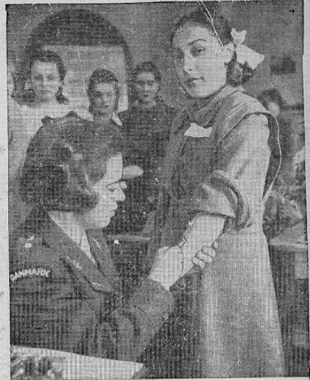
COMBATIENDO LA TUBERCULOSIS, la Organización Mundial de la Salud y el Fondo de Secorro a la Infancia con ayuda de la Cruz Roja danesa, examinan 50,000,000 niños europeos y vacunan los que no están afectados por la terrible enfermedad.