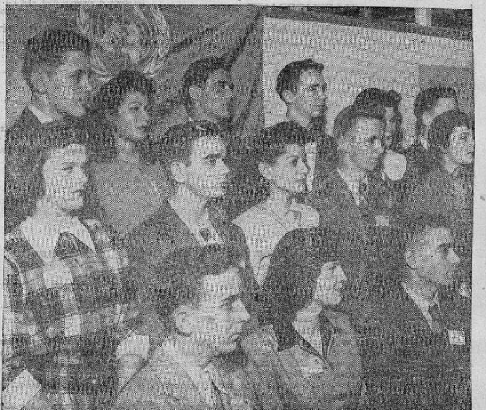
DE TODAS PARTES del mundo llegan visitas a la Sede de las Naciones Unidas, pero cada vez mayor número a medida que progresan las organizaciones interesadas de una manera u otra en la ONU. Un grupo de estudiantes a su llegada a la Sede en Lake Success, New York.

caudaloso robo cometido sin dejar señales ni pistas, en el propio centro de la ciudad.