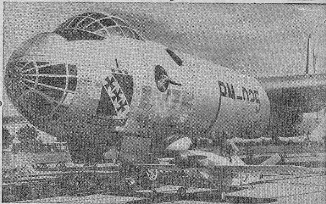
Un avión de carrera de 85 caballos de fuerza, siendo el tipo más pequeño de esta índole que jamás se ha inscrito en las Carreras Aéreas Nacionales recientemente celebradas en Cleveland, Ohio. Se le ve al lado de un superpotadoro de seis motores tipo B-36 de la Fuerza Aérea de los Estados Unidos, en una de las pistas del Aeropuerto Municipal. El avión miniatura tiene una velocidad máxima de 220 millas por hora. El inmenso avión de 3.000 caballos de fuerza tiene una velocidad máxima de más de 300 millas por hora.

CHICAGO 26 UP — El presidente Truman aseguró al partido republicano, que alberga en su seno — de la misma clase que llevaron al poder a Hitler, Mussolini y Tojo. Un discurso pronunciado en el estadio de Chicago, Truman dijo que los principales líderes republicanos han dado indicaciones que seguirán la parte que señalan esos elementos. Mañana en la noche, en el mismo lugar, hablará el rival republicano Thomas Dewey. Aunque no mencionó nombre alguno, el presidente dijo — poderosas fuerzas reaccionarias pueden ser tres categorías: la primera. Los hombres quienes quieren que la inflación siga adelante sin freno. Segunda. — Los hombres quienes quieren concentrar gran poderío económico en sus propias manos. Tercera. — Los hombres quienes les interesa estimular la discriminación racial religiosa contra algunos de nuestros compatriotas.