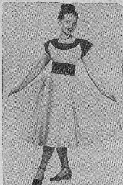
VESTIDO ANCHO PARA EL VERANO — Esta bella morena norteamericana nos exhibe la última moda en vestidos de verano que como pueden ver nuestros lectores es bastante ancho y cómodo